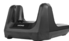
Зарядная станция (Cradle)