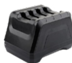
4-х зарядная станция для батарей